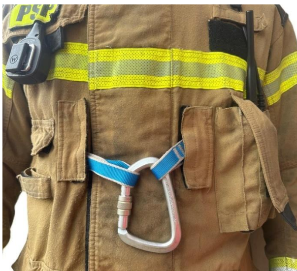
Grafika 1 Pętla zszywana umieszczona w dedykowanym miejscu kurtki ubrania specjalnego

Odpowiednie przygotowanie i wyposażenie strażaków do działań minimalizuje ryzyko wystąpienia sytuacji niebezpiecznej lub potencjalnie niebezpiecznej, które jak dobrze wiemy podczas działań ratowniczych występują. Każdy ratownik biorący udział w działaniach powinien posiadać wiedzę i umiejętności w jaki sposób poinformować o zaistniałej sytuacji oraz jak w sytuacji zagrożenia postępować. Oprócz wiedzy i umiejętności strażakowi niezbędny jest sprzęt, który ułatwi mu działanie w stresującej oraz trudnej sytuacji, gdy znajdzie się w niebezpieczeństwie. Każdy strażak powinien być dodatkowo wyposażony w dwie pętle zszywane 120 cm + karabinek z blokadą zamka. Jedna z taśm w miarę możliwości powinna stanowić nieodłączny element kurtki ubrania specjalnego. Część dostawców ubrań specjalnych zapewnia możliwość doposażenia kurtki w pętlę zszywaną, którą można przeciągnąć przez przygotowane kieszenie na klatce piersiowej oraz plecach.