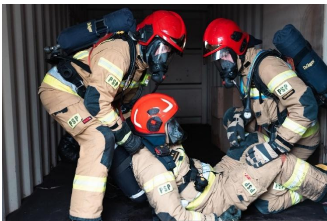
Skrypt do szkolenia doskonalącego z zakresu działania rot asekuracyjnych

Ponadto, wprowadzenie rot asekuracyjnych do standardowych operacji straży pożarnej jest zgodne z Polskimi oraz międzynarodowymi standardami, przepisami i rekomendacjami w zakresie bezpieczeństwa służb ratowniczych. Wiele tragicznych wydarzeń z przeszłości pokazało, jak ważne jest posiadanie dedykowanych zespołów gotowych do natychmiastowej interwencji w sytuacjach kryzysowych. Uczenie się na tych doświadczeniach pozwala unikać podobnych błędów w przyszłości i podnosić standardy bezpieczeństwa.