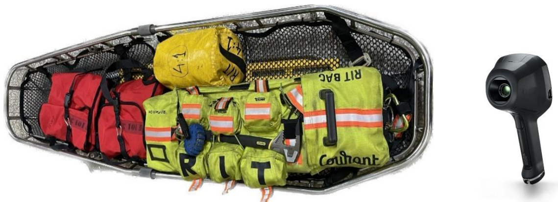
Grafika 4 Sprzęt rot asekuracyjnej

Sprzęt asekuracyjny umożliwia sprawną ewakuację uszkodzonego strażaka w pionie oraz poziomie. Dodatkowo może posłużyć jako zabezpieczenie rot asekuracyjnej. Warto podkreślić, że kompleksowy wykaz sprzętu potrzebnego do prowadzenia działań ratowniczych w ramach rot asekuracyjnej RIT, stanowi załącznik do zatwierdzonego przez komendanta głównego PSP programu szkolenia.