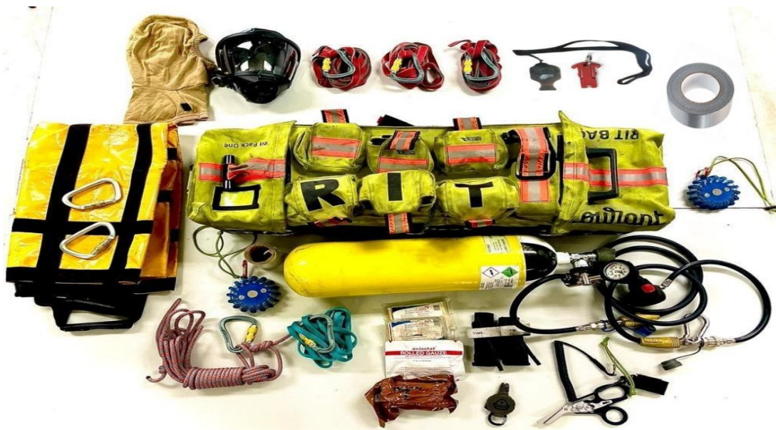
Grafika 3 Torba RIT wraz z wyposażeniem

Ponadto rotę asekuracyjną wyposażono w sprzęt asekuracyjny, który ułatwi prowadzenie ewakuacji poszkodowanego w pionie lub w poziomie. W skład sprzętu asekuracyjnego wchodzi: