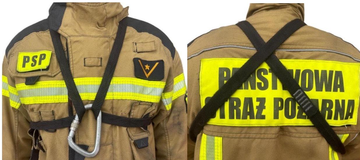
Grafika 2 Pętla zszywana na kurtce ubrania specjalnego w przypadku braku miejsca dedykowanego do montażu

Drugą pętlę zszywaną najlepiej umieścić w kieszeni spodni ubrania specjalnego. Pętle te podczas działań ułatwiają pracę rotę asekuracyjnej m.in. podczas ewakuacji poszkodowanego strażaka, a w przypadku potrzeby samoratownia zestaw taki może posłużyć jako improwizowana uprząż.